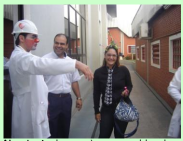
Alegria: Ao chegarem à empresa, colaboradores foram recepcionados pelos Doutores do Coração, com muita alegria e brincadeiras.

As palestras, campanha de saúde, dinâmicas e murais da SIPAT só iremos mostrar na próxima edição, pois o encerramento do evento se dará neste próximo dia 28 de outubro.