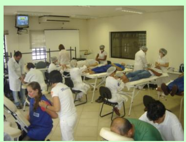
Bem estar: Colaboradores viveram bons momentos com massagens. (foto acima e abaixo)