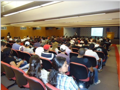
Interesse: Os mais de 150 profissionais presentes “curtiram” as duas horas de apresentação e se manifestaram positivamente sobre a necessidade de aplicação maior no setor. Envolvidos no assunto (como mostra foto abaixo), os profissionais puderam ampliar visões para uma melhor SST.