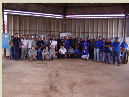
Trabalho seguro: A capacitação de segurança em trabalho em altura é um dos itens da vasta programação que a AVAF mantém em sua unidade de Valparaíso, sempre com objetivos de manter a segurança em primeiro lugar. É a valorização da saúde e vida do trabalhador!