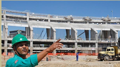
Moisés: de volante do Botafogo a técnico de segurança do trabalho

- Fiz um golzinho em 94, contra o Atlético Mineiro - afirmou.