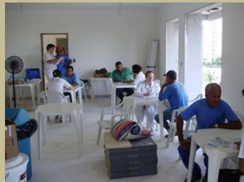
Exames: Em todas as obras da Constroen foram montadas acomodações confortáveis para que os profissionais do SESI pudessem atender com tranquilidade os colaboradores.