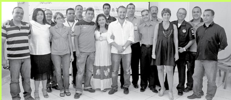
Equipe: O grupo de servidores da Prefeitura de Guarujá (SP) que formam a nova CIPA, Gestão 2011/2012, está unido e tem metas de colocar a segurança em primeiro lugar