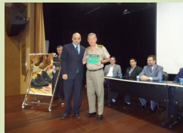
Coronel Washinton França representando o Governo da Paraíba.