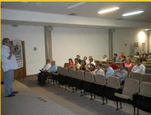
O evento foi realização do SinduscoSP, através do "programa sindusco-sp de segurança".