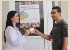
Menino: Os colaboradores também tiveram informações personalizadas no combate da doença.

Os colaboradores também foram orientados a procurar a Secretaria Municipal de Saúde para providenciar teste rápido que vem sendo oferecido gratuitamente.