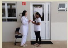
Menina: Informações especiais foram dirigidas para as colaboradoras.