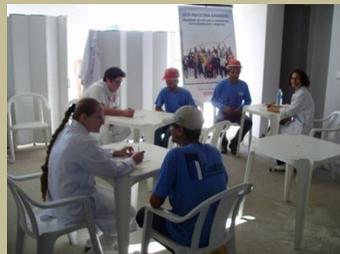
Cada exame realizado o colaborador era orientado sobre ações preventivas.