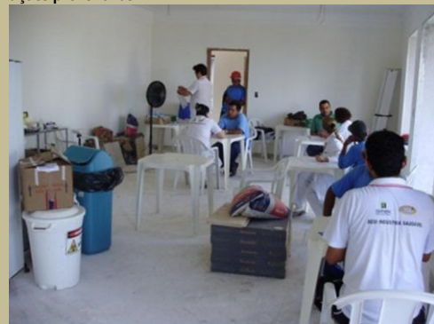
Ação: Agora o departamento médico dará continuidade.