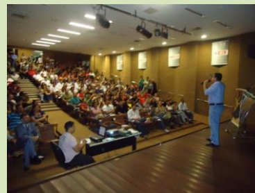
Sucesso: Público com mais de 400 pessoas prestigiaram o evento, registrando a força da classe.