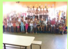
Alegria de doadores e crianças