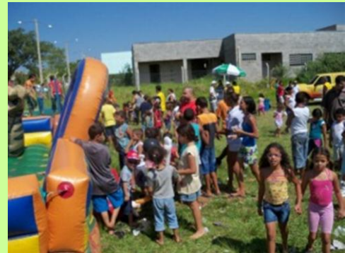
Diversão: Muitas brincadeiras envolveram as crianças em Birigui (SP).