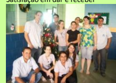
Orgulho de fazer parte da equipe e proporcionar um Natal Feliz.