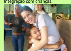
Alegria externa em forte abraço.