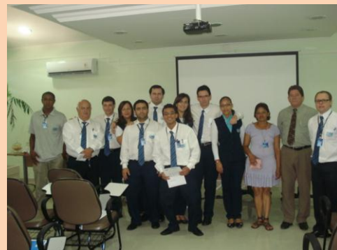
Saúde e Segurança: Colaboradores da AME – Ambulatório Médico de especialidades de Promissão (SP) no encerramento do curso de capacitação receberam certificados e estão prontos para atuarem na prevenção de doenças e acidentes do trabalho.

O AME de Promissão é administrado pela Santa Casa de Misericórdia de Araçatuba (SP).