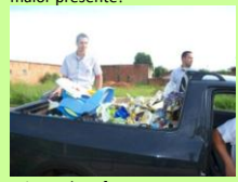
Brinquedos foram transportados em camionete e fez a alegria dos voluntários.