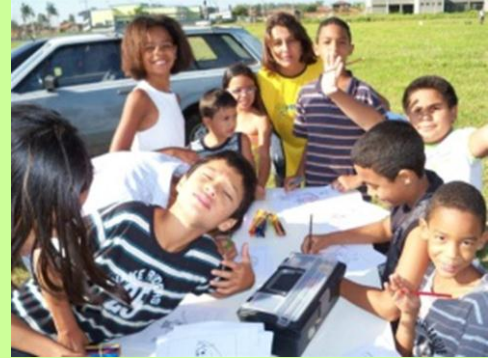
Alegria: crianças de Birigui em festa a cargo da Printbill.

O grupo Printfest agradece a todos os voluntários que estiveram presentes neste evento social, e deseja a todos um Feliz Natal e um Próspero Ano Novo.