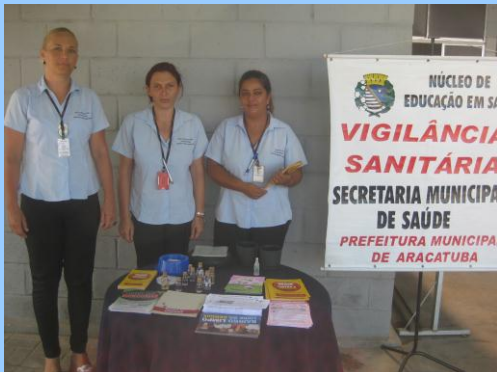
Parceria: Funcionários da Vigilância Sanitária de Araçatuba (SP) fizeram parceria com a COPEL nas atividades de levar conhecimentos e orientações aos colaboradores da empresa.