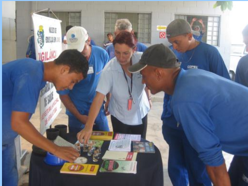
Conhecimento: orientações foram repassadas aos colaboradores da COPEL para combater a dengue.

O trabalho de sensibilização aplicado na campanha, leva a todos os colaboradores da COPEL a levarem para suas comunidades melhores informações e atitudes práticas para combater a doença que assola a região nesta época do ano.