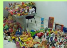
300 brinquedos arrecadados

A Printbill termina o ano de 2011 participando de muitas ações sociais e ambientais. Os resultados das ações motivam outras ideias e ações responsáveis para 2012, contando principalmente com parcerias e voluntários interessados em fazer a diferença.