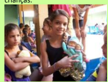
Um sonho realizado. Alegria, o maior presente!