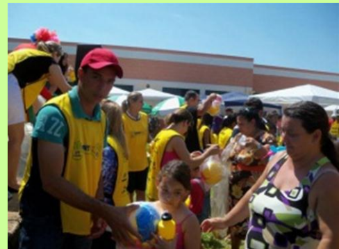
Parceria: Voluntários da Printbill e de várias outras empresas somam esforços para proporcionar bem estar à população de Birigui (SP).