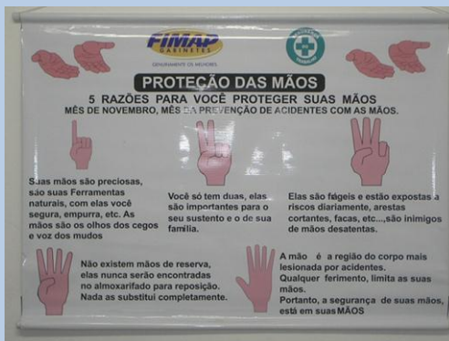
Ilustração: Vários cartazes com fotos foram exibidos aos colaboradores para aumentarem os cuidados com as mãos.

Palestras: Durante o mês de novembro, colaboradores da FIMAP foram orientados e informados sobre a prevenção de acidentes que envolvam as mãos.