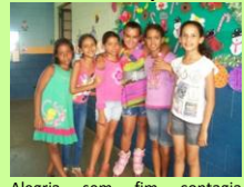
Alegria sem fim contagia crianças.