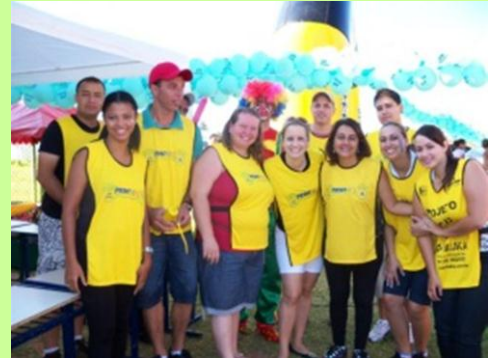
Equipe: Voluntários levam alegria, festa e saúde aos futuros trabalhadores.