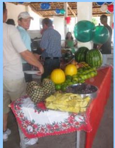
Saúde: Mesa farta com alimentos mais saudáveis fez parte da confraternização da COPEL.

E em meio a festa ocorreu orientações sobre alimentação mais saudável.