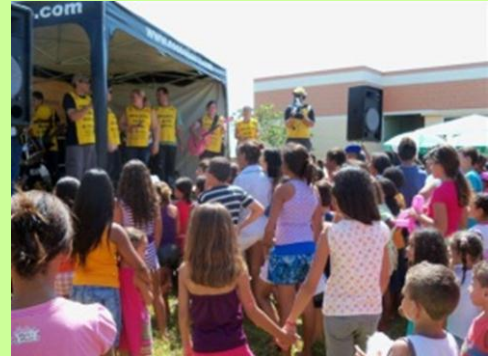
Integração: As atividades do evento proporciona integração de colaboradores da empresa com a comunidade e neste a criança se congerataram em festa natalina.