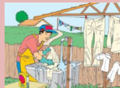
Higienização de uniformes ainda tem muita discussão.

De acordo com o projeto, as empresas/indústrias que se utilizam desse tipo de produto, podem, se preferirem, contratar serviços de terceiros, desde que o tratamento dos efluentes resultantes dessa lavagem obedeça à legislação vigente de proteção ao meio ambiente.