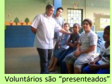
Voluntários são “presenteados” com calor das crianças.