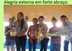
Satisfação em dar e receber