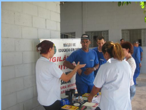
Comunidade: Atentos, colaboradores da COPEL estão levando conhecimento para agir junto à comunidade onde residem.