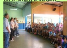
Integração com crianças.