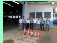
Encerramento: Novos membros da CIPA estão capacitados para ações da manutenção da prevenção, cuidados com a saúde e integridade físicas dos colaboradores da RETESP da unidade de Penápolis (SP).