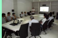
3º Dia: Noções sobre a Síndrome da Imunodeficiência Adquirida (AIDS), e medidas de prevenção; Doenças Sexualmente Transmitidas; Noções de Primeiros Socorros.