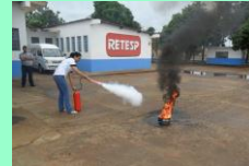
5º Dia: Elementos essenciais para a combustão, tetraedro do fogo, agentes extintores, classe de incêndio, métodos de extinção, Primeiros socorros em caso de queimaduras, graus de queimaduras e treinamento prático das noções básicas de Primeiro Socorros e Combate a Princípio de Incêndio.