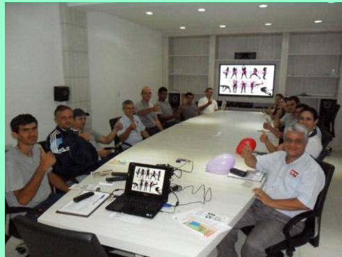
Envolvimento: Capacitação de cipeiros permite que membros tenham possibilidade de ações práticas no dia a dia com finalidade de monitorar e melhorar as condições de trabalho.