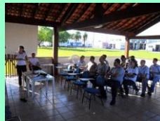
1º Dia: Noções sobre as legislações trabalhistas e previdenciárias relativas à segurança e saúde no trabalho; Organização da CIPA e atribuições de seus componentes.