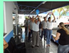
4º Dia: Noções sobre Ergonomia do Trabalho, LER/DORT e medidas de prevenção; Exercícios Laborais, Tipos de Ginásticas Laborais e suas aplicações, Ginástica de relaxamento e Dinâmicas.