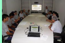
2º Dia: Estudo do ambiente, das condições de trabalho, bem como dos riscos originados do processo produtivo; Metodologia de investigação e análise de acidentes e doenças do trabalho; Noções sobre acidentes e doenças do trabalho decorrentes de exposição a riscos existentes na empresa; princípios gerais de higiene do trabalho e de medidas de controle dos riscos.