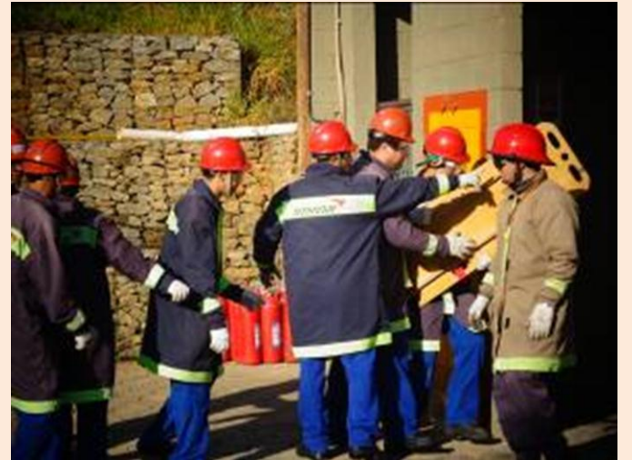
EQUIPE: Colaboradores capacitados demonstraram verdadeiro empenho nas atividades que envolveram a equipe positivamente.