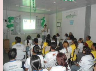
"DST/AIDS" foi tema que reuniu cerca de 150 colaboradores.