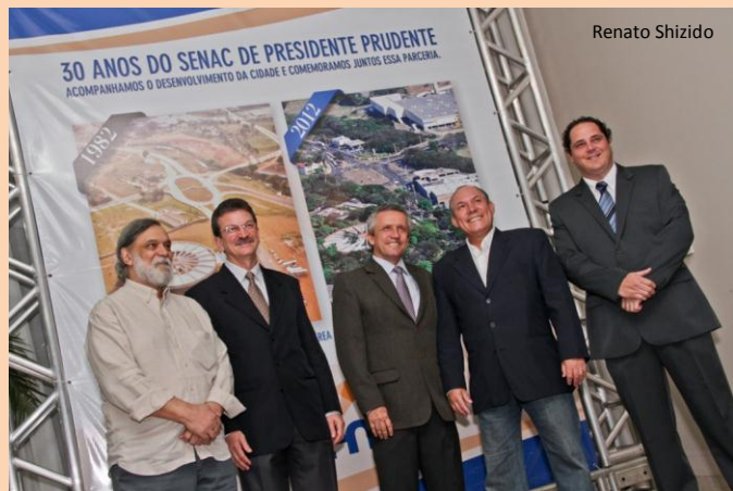
COMANDO: gerentes que passaram pela unidade foram homenageados.