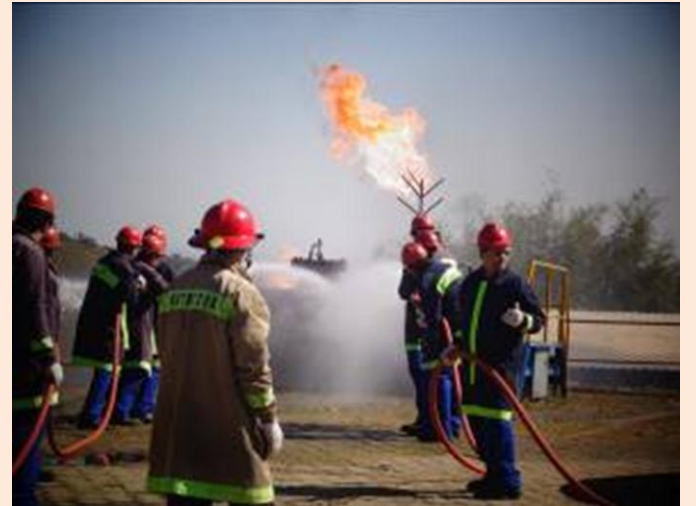
COMBATE: A pista adequada e com várias opções de treinamento possibilitou a equipe da Saint Gobain de se capacitar e manter prontidão para aplicações de medidas preventivas, bem como a de combate em caso de necessidade.

A unidade de Guarulhos (SP) da Saint Gobain já possui a Brigada de Incêndio constituída há tempo e o treinamento de capacitação proporcionou a integração de novos membros com treinamentos adequados e reciclagem aos demais.