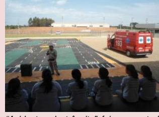
"Acidentes de trânsito" foi apresentada para cerca de 200 colaboradores.