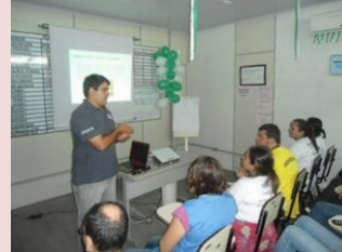
"A importância da educação alimentar" foi tema de palestra.

Entre concursos de cartazes, palestras e charada da segurança com qualidade, algumas equipes foram escolhidas para irem à sede da empresa, em Birigui (SP) para participarem de capacitação sobre o tema da SIPAT.