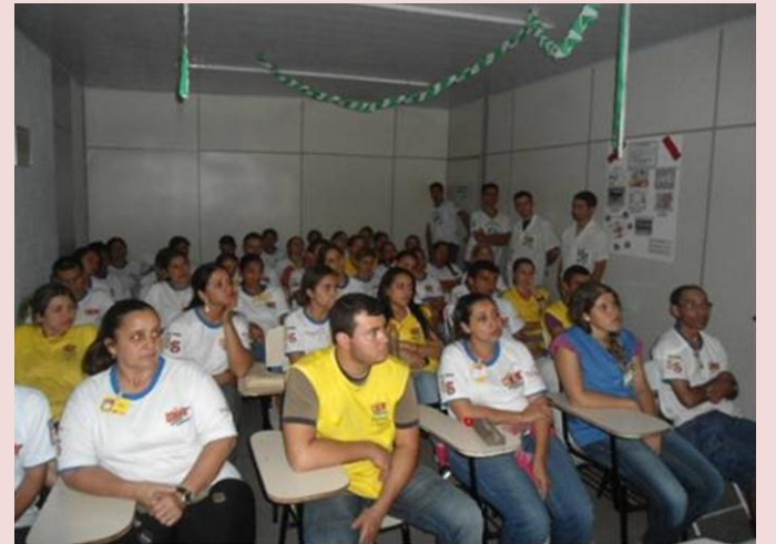
SAÚDE: Colaboradores da Kidy calçados em Três Lagoas (MS) demonstraram em evento, que a qualidade é feita com segurança e que a segurança é aplicada com qualidade. Enfim, a saúde é matéria prima em todas as ações daquela filial.