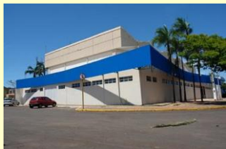
19ª SIPAT: Casa da Cultura será palco do evento prevencionista em Ilha Solteira (SP).