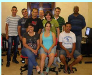
ALEGRIA: Colaboradores das indústrias gráficas de Birigui (SP) recebem com muita alegria os investimentos do SINGRABI