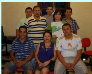
Futuro: Singrabi aplica hoje para garantir ou melhorar o futuro de seus contribuintes. Parabéns pela iniciativa.