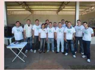
Esta é a primeira turma que foi escolhida para participar do "Dia de Qualidade" na central da Kidy em Birigui (SP).