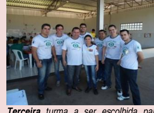
Terceira turma a ser escolhida para treinamento sobre qualidade na sede da empresa em Birigui.