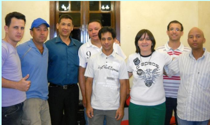
DIGITAL: Contribuintes do SINGRABI sempre recebem investimentos em suas formações profissionais e pessoais. A informatização é uma delas.

"São as parcerias que fazem a diferença, juntos acreditamos que podemos ajudar no crescimento e na capacitação dos contribuintes". (Singrabi - Gestão 2011/2013).