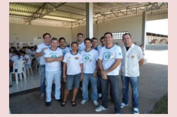
Segunda turma a ser escolhida para participar de treinamento na sede da empresa em Birigui.