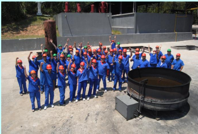
PRÁTICA: Colaboradores preparados para início do treinamento prático de Combate a Incêndio.