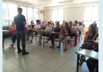
Alunos recebem informações