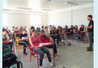
SINTESEC se une com entidades e leva informações sobre SST nas escolas de Santa Catarina.