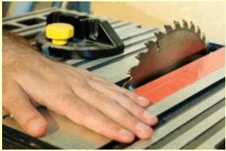
AUMENTO: Emissão de CAT aumenta no país.

A 20ª edição do Anuário Estatístico da Previdência Social (AEPS), divulgada nesta quarta-feira, 24 de outubro, apontou um aumento nos acidentes de trabalho e também nos óbitos em 2011 com relação a 2010. Segundo o Anuário, em 2011 foram registrados 711.164 acidentes no Brasil, contra 709.474 em 2010. Também foram registrados 2.884 óbitos no último ano, sendo que em 2010 o número era de 2.753 óbitos.