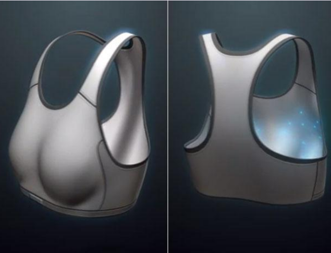
O sutiã é capaz de detectar a doença pelo calor do corpo

Um sutiã desenvolvido pela empresa norte-americana First Warning Systems promete diagnosticar o câncer de mama. O produto é equipado com uma série de sensores capazes de captar mudanças de temperatura no tecido mamário e oferecer uma impressão digital que detecta a presença de células malignas. De acordo com a empresa, os dados gerados pelo sutiã têm 90% de acerto. As mulheres podem usá-lo por 12 horas para acumular uma leitura precisa da temperatura. A partir disso, podem ser gerados quatro tipos de resultados: normal, benigno, suspeita de anormalidades do tecido mamário ou prováveis anormalidades do tecido mamário. A ideia de usar a temperatura para diagnosticar a doença surgiu porque os tumores precisam de nu-