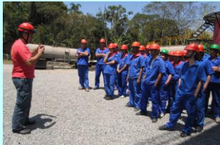
Instrução para entrada em prédio que simula corredores tomados por fumaça e sem iluminação.