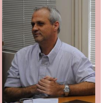
POSSE: Auditor do Rio Grande do Sul é nomeado novo chefe de fiscalização do Trabalho.

Que o novo Secretário possa conduzir as inspeções com lisura.