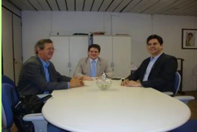
PRESEÇA: Reunião da FENATEST junto ao Diretor do Departamento de Segurança e Saúde no Trabalho do Ministério do Trabalho e Emprego.