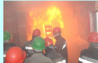
ADMINISTRAÇÃO: Simulação de incêndio em escritório permitiu vivência em situações reais.