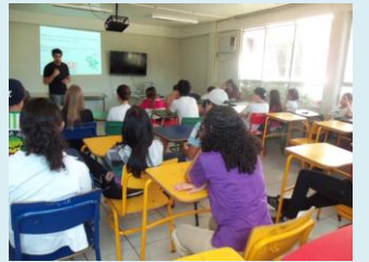
TST fala sobre SST para alunos

O material informativo que o SINTESEC está utilizando é de fácil interpretação e tem motivado alunos e professores a se interessarem pela Segurança e Saúde no Trabalho.