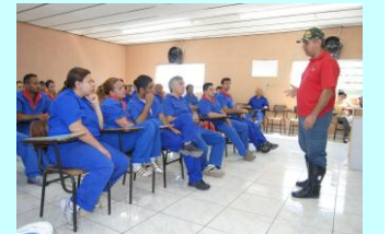
TEORIA/EMERGÊNCIA: Colaboradores recebendo instruções teóricas de combate a incêndio e primeiros socorros.

O treinamento de capacitações foi realizado no Centro de Treinamento Extellpp, localizado em Suzano (SP), que permitiu adequadas condições de mobilização e eficientes ações simuladas ao combate de sinistros e atendimento de emergência, garantindo assim formação de excelência tanto na prevenção como no combate.