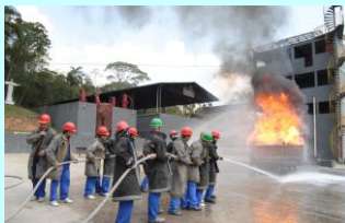
Combate em equipe.