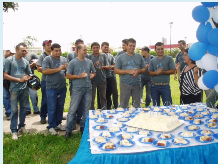
Colaboradores festejam os 17 anos de Printbill em Birigui (SP)

Sabe-se que, no segmento gráfico, tecnologia gera qualidade. E por estar em sintonia com os avanços tecnológicos, os investimentos em equipamentos e treinamentos tem sido uma constante na história da Printbill. Com a mesma intensidade que