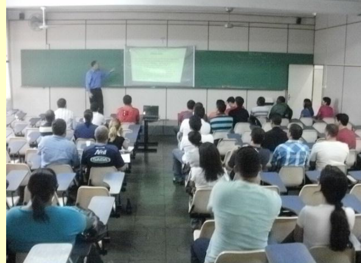
INFORMAÇÃO: Profissionais buscam capacitação e querem mais movimentação no setor motivados pela criação da ABRATEST.

que "a Juíza da 35ª Vara do Trabalho de Belo Horizonte de MG determinou o prazo máximo de 60 dias, a partir da publicação da sentença, para fazer as eleições do SINTEST/MG e que qualquer tentativa de protelar por parte da administração do sindicato é atentar contra a democracia e manter a todo custo à prerrogativa de uma representação ilegítima". Atualmente o sindicato é dirigido por liminar da 22ª Vara do Trabalho de Belo Horizonte. Prosseguiu dizendo que a categoria "anseia a quase 25 anos que o sindicato de Minas possa fazer realmente seu papel de representante legítimo dos profissionais Técnicos de Segurança do Trabalho no Estado". Finalizou dizendo que "todos devem se manifestar perante o Ministério Público que acompanha a situação e na 35ª Vara Justiça do trabalho, através de ações e petições, filiar e/ou votar nas eleições sindicais para que possamos avançar e fortalecer a categoria no Estado de MG".