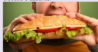
APOIO: Quem tiver estômago reduzido paga menos em Campinas (SP)