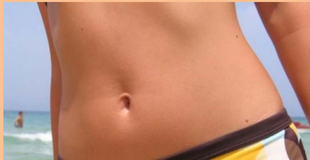
Para emagrecer você precisa aliar a prática de exercícios a uma alimentação saudável

Existe uma hora ideal para malhar? Levantar peso engorda? Preciso suar em bicas para emagrecer? Descubra o que é verdade e o que não passa de uma grande mentira na prática de exercícios.