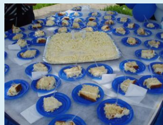
Bolo foi servido a mais de 180 colaboradores

os investimentos são direcionados para novas tecnologias, a empresa investe no seu quadro funcional através de cursos e treinamentos, e visitas em feiras & congressos nacionais e internacionais.