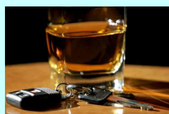
NÃO COMBINA: bebida e direção é "casamento perfeito" para acidentados.