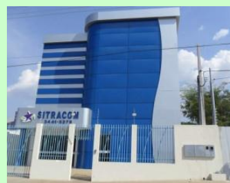
SST EM RONDÔNIA: Sindicato dos Trabalhadores no Comércio de Bens e Serviços do Estado de Rondônia (SITRACOM-RO) vai receber profissionais para discutir o assunto em Seminário.

Os assuntos a serem abordados serão: Obrigatoriedade da NR7,PP-RA/CIPA, laudo de insalubridade/avaliação ambientais, técnicas em saúde e segurança do trabalho, plano nacional de segurança e saúde no trabalho, o papel do movimento sindical em segurança e saúde no trabalho, histórico de ações do SESI, nú-