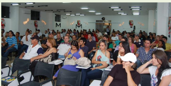
NACIONAL: Diretores da Regional do SINTESP de Presidente Prudente (SP) reuniram mais de 150 profissionais da SST para comemorar o Dia Nacional do Técnico e Engenheiro de Segurança do Trabalho e discutiram as Instruções Técnicas do Corpo de Bombeiro do Estado de São Paulo.

Para o próximo ano já está em andamento outros eventos na Região de Presidente Prudente (SP).