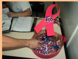
Distribuição dos preservativos sendo realizada voluntariamente, quando da retirada dos EPI's.