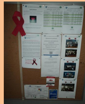
A divulgação foi feita através de MURAL, DDS, Correio Eletrônico, e o Símbolo da campanha foi feito com material EVA.

Companhia Nacional de Álcool é sediada em Piracicaba (SP) e vem despontando no setor da prevenção com vasta programação anual, envolvendo todos os seus colaboradores, confirmando assim que a segurança do trabalho e o bem estar no trabalho deve ter a soma dos trabalhadores.