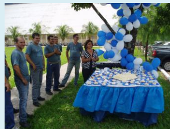
Colaboradores de todos os departamentos estão sempre empenhados na integração de ações comuns.

A empresa conta com um departamento especializado no desenvolvimento de projetos de embalagens, displays e estojos/kits, utilizando os diversos tipos de materiais e recursos de enobrecimento.