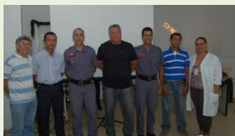
Diretores da Regional do Sintesep – Presidente Prudente/SP, Palestrante e Representantes do Instituto Educacional U.D.