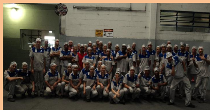
Participação e envolvimento de todos. A divulgação ocorreu entre familiares, amigos, parceiros de trabalho e tudo com seriedade, dinamismo e muito sorriso.