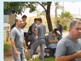
Eventos envolvem todos os colaboradores em programações realizadas durante o ano todo.

O Jornal Printbill em Ação é uma publicação impressa trimestral que é distribuída ao setor, no intuito de fornecer as mais diversas e atuais informações sobre os assuntos que a empresa participa, também em versão virtual disponibilizada no website www.printbill.com.br