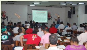
Profissionais da região de Presidente Prudente (SP), inclusive das cidades de Ourinhos e Assis se encontraram para comemorar o Dia Nacional do Técnico e Engenheiro de Segurança do Trabalho.