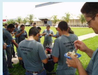
Colaboradores comemoram 17 anos de empreendedorismo nos serviços e na SST

Instalada num área de 12.000m², a Printbill tem capacidade total para a conversão de mais de 8 milhões de embalagens em micro-ondulado mensais.