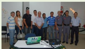
Profissionais da SST das cidades de Assis e Ourinhos/SP, diretores da regional do SINTESP e Bombeiros de Presidente Prudente.