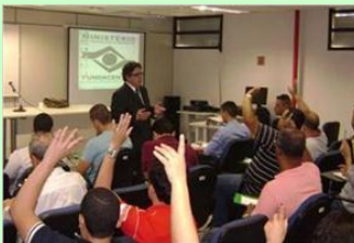
Iniciativa do CERJ atualiza sobre avaliação e controle

A Fundacentro iniciou no último dia 10 de junho, um curso sobre riscos químicos no Centro Estadual do Rio de Janeiro - CERJ. O objetivo é oferecer aos participantes conhecimentos técnicos básicos, que permitam uma boa compreensão sobre esse tipo de risco e do agravo à saúde dos trabalhadores causado pela exposição ao mesmo.