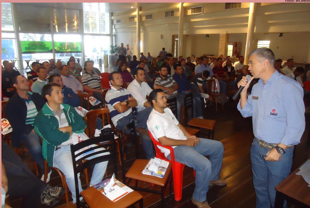
SUPER WORKSHOP: Profissionais da Segurança e Saúde do Trabalho das regiões de Araçatuba (SP) e Bauru (SP) foram atualizados e integrados aos recursos de prevenção no trabalho em altura, espaço confinado e rede energizada. Evento foi realizado pela LEAL Equipamentos, com apoio de Norminha.

O Super Workshop foi realizado no dia 06 de junho de 2013, no Centro de Eventos Figueira de Araçatuba (SP) e em Bauru (04/06/2013), quando das 08 às 17h30, mais de 180 profissionais da segurança e saúde do trabalho de empresas daquelas regiões estiveram discutindo, obtendo informações específicas e qualificadas de representantes da Leal Indústria e Comércio, promotora do evento e apoio de "Norminha".