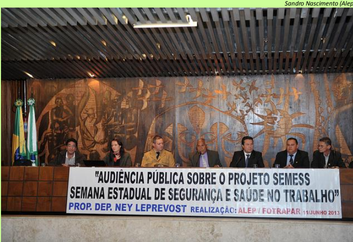
Audiência Pública que discute a Semana Estadual de Segurança e Saúde no Trabalho no Paraná.