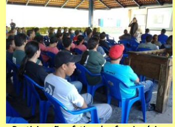
Participação efetiva dos funcionários.