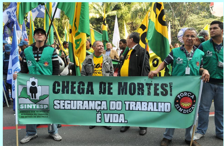
SINTESP participou do Dia Nacional de Luta das Centrais Sindicais e fez sua parte em prol da Segurança e Saúde do Trabalho. (Fotos acima e abaixo)