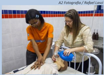
Estão abertas as inscrições para o curso de primeiros socorros. O curso é voltado a professores-coordenadores, diretores e vice-diretores de unidades escolares da rede estadual.