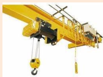
Cursos irão capacitar profissionais a ministrarem cursos conforme exigência da NR 11.

O SINTESPAR (Sindicato dos Técnicos de Segurança do Trabalho no Estado do Paraná) tem programação definida para realizar cursos de formação de instrutores para ministrarem cursos de Operador de Empilhadeira e Ponte Rolante. Os cursos serão realizados em Curitiba (PR) no mês de agosto.