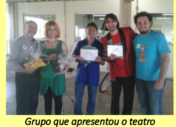
Grupo que apresentou o teatro