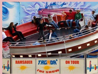
Brinquedo semelhante ao qual a jovem estava quando sofreu o acidente.