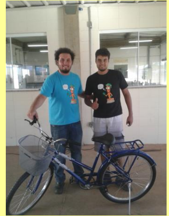
Sortudo que levou a bicicleta.