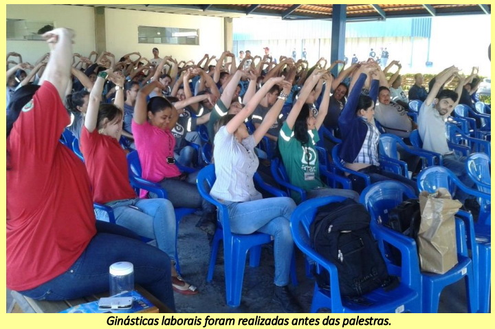
Ginásticas laborais foram realizadas antes das palestras.

A ADAR Tecidos, uma das mais completas empresas do setor, através de seu SESMT realizou em sua unidade de Três Lagoas (MS) neste mês de julho, várias atividades preventivas envolvendo todos os seus empregados, entre as quais destacamos: Realização de curso de capacitação (Reciclagem) para operadores de empilhadeira, visando a melhoria constante nas ações dos operadores de empilhadeira, oportunidade em que os mesmos foram submetidos a testes teóricos e práticos na busca de utilizar as noções de espaço e operação adequada da máquina. Já, os novos membros da CIPA da gestão 2013/2014, foram capacitados pela equipe do SESI de Três Lagoas (MS), que além do curso completo conforme exige a NR 5, receberam também treinamentos em primeiros socorros. Com a capacitação os novos membros da Comissão Interna de Prevenção de Acidentes estão prontos para cumprir suas atribuições com olhar clínico às condições e ações seguras. Que tenham sucesso na prevenção!