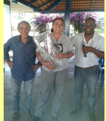
Ganhadora do faqueiro