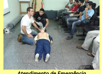
Atendimento de Emergência