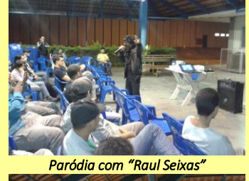
Paródia com "Raul Seixas"