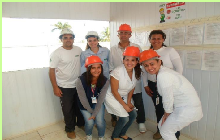
UNIÃO: Equipe de profissionais da MRV e do Posto de Atendimento em Araçatuba (SP) que desenvolveram a campanha de vacinação, imunizando mais de 100 colaboradores.