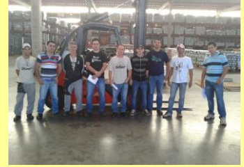
Treinamento Operador Empilhadeira