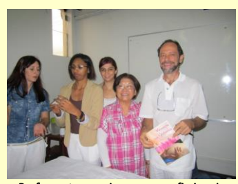
Professor teve carisma com profissionais.