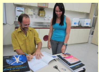
Professor autografa seu livro para aluna

No dia 09 de agosto de 2013 compartilhou sua experiência profissional e esclareceu diversas dúvidas dos estudantes dos cursos Técnicos em Massoterapia, Enfermagem e Farmácia do Senac de Araçatuba (SP). A ação contemplou o início do módulo V do curso de massoterapia, intitulado Massagens Orientais.