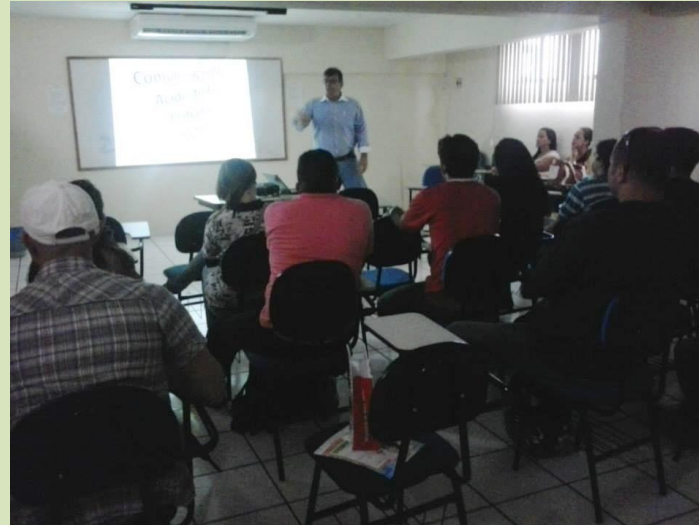
Capacitação vem sendo desenvolvida por profissionais com ampla vivência no setor da SST

O próximo Workshop da Segurança do Trabalho já tem data e assunto defi-