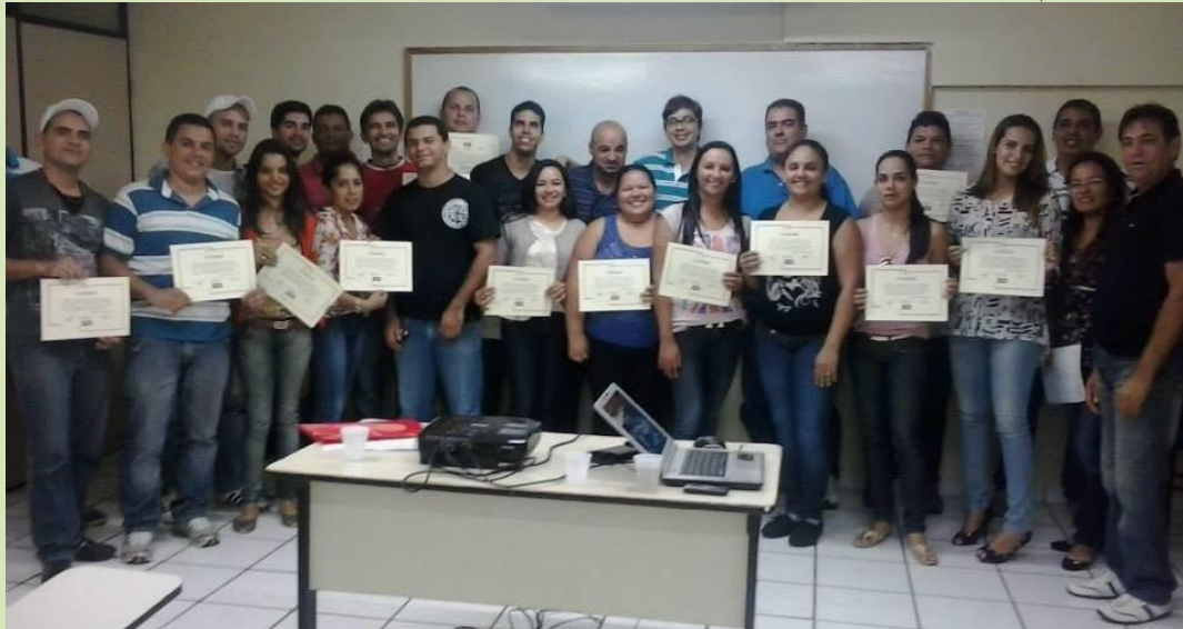
Profissionais da SST da Paraíba estão sendo capacitados/reciclados através de workshops promovidos pelo SINTEST-PB