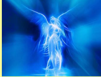
Por: Wagner Borges