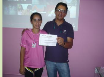
TST Everton entrega prêmio