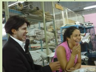
Show do milhão deu alegria!