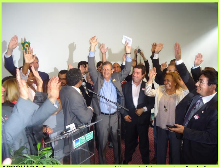
APROVADA: Exato momento em que publicamente foi aprovada a Comissão de Coordenação da Frente Parlamentar sobre Segurança e Saúde do Trabalho.