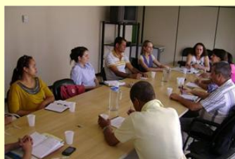
Por ACS / C.R.

Instituições discutiram demandas para 2014