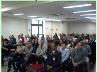
Público prestigiou evento

Nos discursos prevaleceu a mensagem de que devem existir mais união no setor e ações proativas. Os Técnicos de Segurança do Trabalho vivem um momento de transição e muito importante e delicado, pois das atitudes deles de agora em diante vai depender o futuro da categoria. Está bem claro de que é importante que o TST seja mais proativo e participado no universo que existe em torno da profissão, saindo do tecnicismo, do atendimento sistemático somente das normas regulamentadoras e do que o empregador exige dele, e passando a ser mais participativo em relação as questões que envolvem a política, uma vez que os legisladores não tem noção real do dia a dia do TST nos ambientes de trabalho e isso influencia muito nas tomadas de decisões, que podem ajudar, mas também prejudicar o desenvolvimento das atividades dos técnicos. E no bojo dessas questões corre-se um sério risco da profissão ser atingida ao extremo de passar a ser somente um cargo de auxiliar.