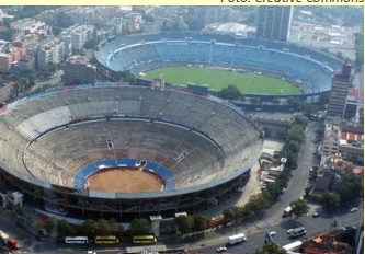
Com capacidade para mais de 41 mil espectadores, a Monumental Plaza de Toros da Cidade do México é a maior do mundo em capacidade de público.

Quando o assunto é tourada, o primeiro país que vêm à mente é a Espanha. Assim, é natural que a maior arena dedicada a este tipo de espetáculo esteja no país europeu, certo? Errado. Com capacidade para mais de 41 mil espectadores, a Monumental Plaza de Toros da Cidade do México supera todas as outras em capacidade de público, mostrando que a tourada é uma paixão tão grande no México quanto na Península Ibérica.