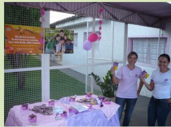
Exposição sobre doenças DST/AIDS

Todas as atividades foram coordenadas para que a participação fosse efetiva por todos envolvidos.