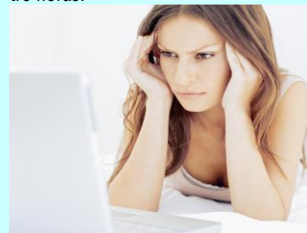
Olá, Dr. Google