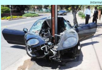
Bruno Paes Manso - O Estado de S. Paulo

Estudo, que considera o período entre 1980 e 2011, mostra retomada da violência no tráfego, impulsionada pela alta de casos com motos