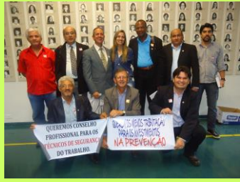
Representantes dos profissionais prevenicionistas fizeram várias manifestações pela valorização da SST em benefício da saúde dos trabalhadores.