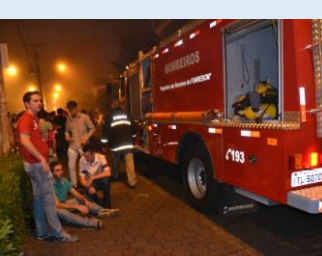
Pessoas passaram mal com o spray