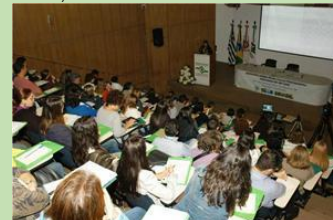
Seminário sobre "Reabilitação Profissional - Discussão de um caso" realizado na Fundacentro/SP em abril de 2013