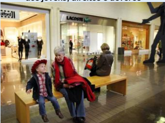
Nos EUA, grupos têm organizado flash mobs em shopping centers; episódios muitas vezes terminam em confrontos.

Debate americano em torno de 'flash mobs' que resultaram em violência tem pontos em comum com o brasileiro, como ocupação do espaço público, motivação dos jovens, direitos e deveres