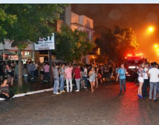
Público esvaziou o local depois do lançamento do gás

O Corpo de Bombeiros foi chamado ao local e encontrou dentro da pista de dança a lata com o spray de pimenta. As imagens das câmeras internas da boate não identificam quem soltou o gás, mas a polícia já tem um suspeito. O homem deve ser chamado para prestar depoimento.