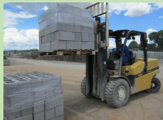
Foram utilizados os próprios materiais de trabalho para que o treinando seja bem específico aos riscos

O curso foi desenvolvido nos dias 26 e 27 de dezembro de 2013 nas próprias dependências da empresa e foi aplicado pelo Técnico de Segurança do Trabalho Esdras Ferreira de Souza.