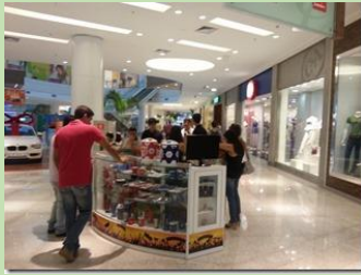
Unidade Parque Shopping Maceió

Maceió, Belém e Recife serão as primeiras capitais das regiões a receberem unidades da rede que promete ser atração durante a Copa do Mundo 2014