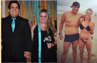
Casal em dois momentos: antes da dieta e hoje, um ano depois