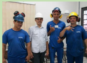
Aptos ao trabalho seguro

As aulas teóricas e práticas foram desenvolvidas de maneira que utilizassem materiais e equipamentos de uso comum dos operadores de empilhadeira que a capacitação seja realmente aplicada junto aos riscos existentes no dia a dia. #