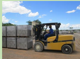
A prática foi aplicada com os próprios maquinários