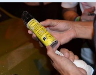
Bombeiros localizaram o spray de pimenta