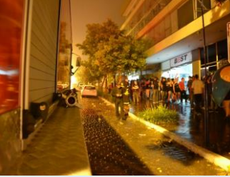
Incidente deixou jovens que estavam na boate assustados