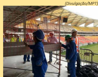
Vitoria tem a finalidade de promover fiscalizações em grandes obras que se encontram em andamento na cidade de Manaus