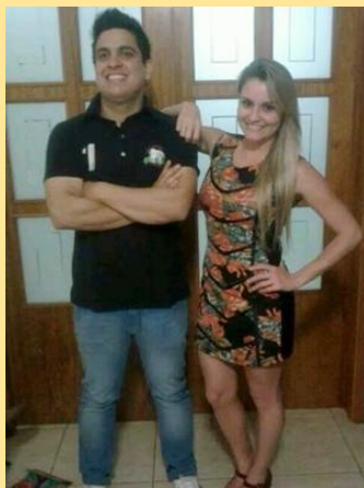
Hoje, com peso ideal, casal pretende continuar rotina saudável