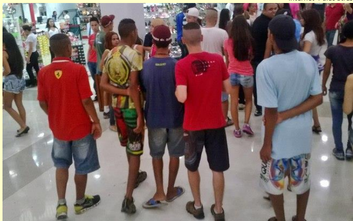
Do G1 São Paulo

Desde o fim de 2013, jovens têm organizado encontros pelas redes sociais, principalmente, em shoppings da capital paulista e da Grande São Paulo. Os eventos ficaram conhecidos como "rolezinhos". A primeira iniciativa a ganhar repercussão aconteceu no Shopping Metrô Itaquera, Zona Leste de São Paulo, em 8 dezembro. Algumas lojas fecharam com medo de saques e o centro comercial encerrou o expediente mais cedo.