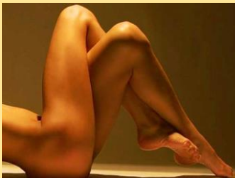
Por: Cristina Cairo

Você guarda em seu corpo todos os detalhes da sua vida: mágoas, ressentimentos, raiva dos outros e de si mesma, nervosismo com determinadas pessoas e a tensão de estar sendo bloqueada em sua liberdade.