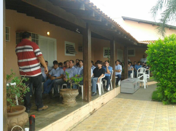
COMPARTILHAR: Colaboradores das empresas AGMTECH e SOLINFTEC de Araçatuba (SP) participaram de Workshop para receberem informações sobre ações da CIPA.