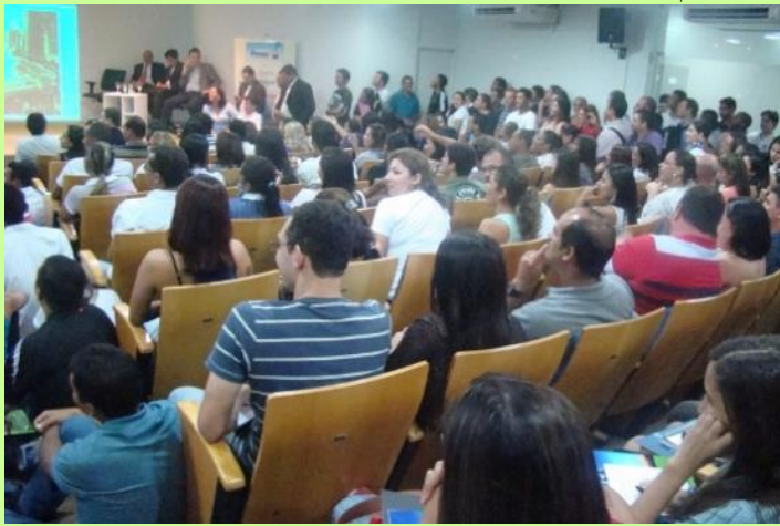
Evento reúne profissionais da Segurança e Saúde do Trabalho para debate e estudos

Está programado para os dias 19, 20 e 21 de março de 2014 a realização da “Caravana Proteção” na cidade de Manaus (AM) que unirá conhecimento de palestrantes experientes e empresas conhecidas do setor de Saúde e Segurança do Trabalho, levando estas informações aos profissionais do estado do Amazonas.