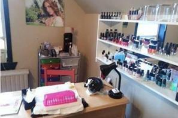
Posto de trabalho da manicure

Premiada no Canadá, socióloga mostra as diferentes interfaces do trabalho da manicure