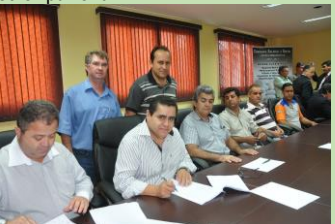
Membros de sindicatos do setor químico

A solenidade de assinatura da Convenção Coletiva dos trabalhadores e trabalhadoras nas indústrias farmacêuticas do estado de São Paulo foi realizada nas dependências do SINDUSFARMA (Sindicato da Indústria de Produtos Farmacêuticos no Estado de São Paulo), e contou com a participação de líderes da Federação, entidade filiada à Força Sindical e à CNTQ, e de seus Sindicatos filiados, juntos com os representantes do setor patronal.