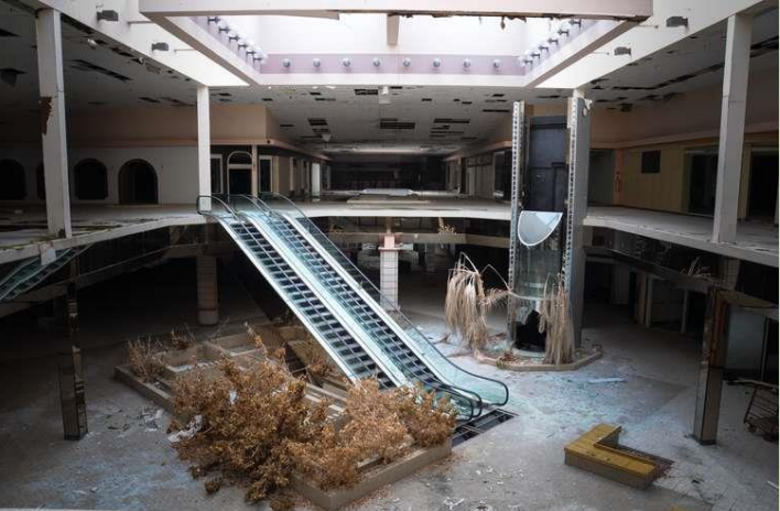
Fotógrafo Seph Lawless acredita que imagens mostram a decadência da sociedade americana