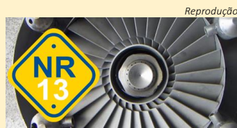
Caldeiras e Vasos de Pressão tem redação atualizada e prazos para cumprir

Confirma publicação do Ministério do Trabalho e Emprego na Seção 1 do Diário Oficial da União (DOU) do dia 2 de maio de 2014, a NR 13 (Caldeiras e Vasos de Pressão) passa a vigorar conforme a redação constante na Portaria nº 594, de 28 de abril de 2014.