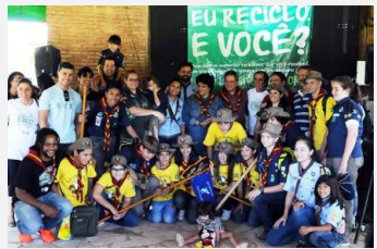
Escoteiros do Brasil participam de mutirão do Limpa Brasil

No próximo dia 10 de maio, o projeto estará em Recife, PE. No Rio, RJ, a previsão é que aconteça já em 2015, depois de passar pelas cidades de Fortaleza, CE (junho), São Paulo, SP (setembro) e Brasília, DF (novembro).