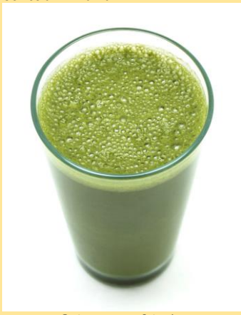
Gripe e resfriado

Bata todos os ingredientes no liquidificador e adoce. Cortesia Thithamá