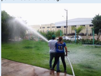
Todos equipamentos disponíveis de combate a incêndio foram utilizados

Os colaboradores revisaram os conceitos de segurança, como tipos de incêndios e extintores específicos para cada um, além de inspeção geral de equipamentos e rota de fuga.