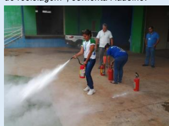
O simples uso periódico do extintor de incêndio mantém os colaboradores da brigada em permanente prontidão