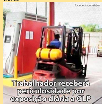
Trabalhador receberá periculosidade por exposição diária a GLP

De acordo com acórdão do Tribunal Regional do Trabalho da 15ª Região (Campinas/SP), entre as atividades exercidas pelo operador de empilhadeira estava a de encher um cilindro de GLP durante uma ou duas vezes ao dia, em operação que durava de um a três minutos. Apesar de o contato com o GLP ser considerado atividade perigosa pela Norma Regulamentadora 16 do Ministério do Trabalho e Emprego (MTE), o Regional considerou que o período de exposição era “extremamente reduzido” e, por isso, o operador não faria jus ao adicional.