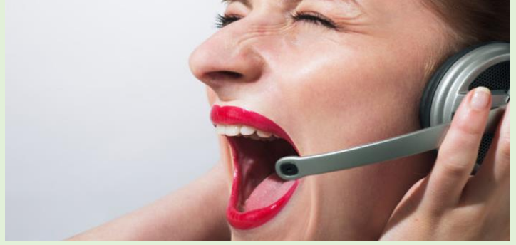
Stress provoca síndrome de burnout em operadora de telemarketing

Demitida por justa causa em outubro de 2010, após dirigir expressão de baixo calão a um cliente, uma teleoperadora da Atento Brasil S. A. Comprovou que sua reação foi causada pela Síndrome de Burnout, também chamada de síndrome do esgotamento profissional.