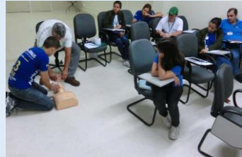
Reciclagem foi completa e brigadistas viveram ações da capacitação e formação do grupo.

O curso de reciclagem para os membros da Brigada de Incêndio é um dos cursos de capacitação que vêm sendo desenvolvidos para elencar as atividades de medidas preventivas nas Arenales de Presidente Prudente. [N]