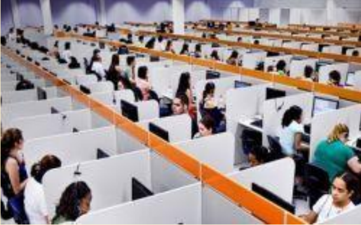
Acidentes matam mais de 2 milhões por ano. Pressões e assédio por metas estão entre as causas

Escrito por: Redação - Rede Brasil Atual