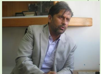
Procurador do Ministério Público do Trabalho

TS: O senhor acredita que a prostituição seja regulamentada ainda neste ano de 2014? MJ: Não. Este é um ano eleitoral, as sessões do Conselho Nacional serão reduzidas, se reunirão muito pouco no segundo semestre. Não creio que esse projeto será aprovado nessa legislatura. Talvez, com muita pressão da sociedade civil, seja aprovado na próxima legislatura.