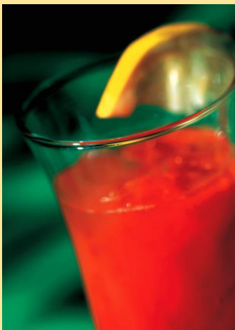
Purificador do sangue

Veja a mistura de frutas e verduras nos sucos e suas funções