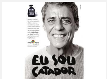
Chico Buarque incentiva a campanha

A iniciativa, cujo slogan é "Eu sou catador", alerta a população em geral, a partir de mobilizações em diferentes cidades do país, sobre a importância de cada cidadão se portar como um agente da transformação e recolher o lixo das ruas sempre que puder. "Ela visa ainda a conscientização para o descarte adequado dos resíduos sólidos que produzimos e, assim, contribuir para que a quantidade de lixo que precisa ser recolhido nas ruas diminua cada vez mais".