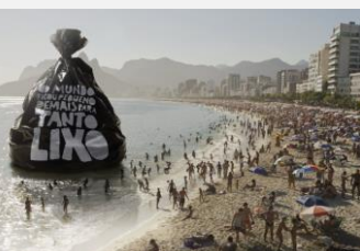
A campanha já passou por diversas cidades do Brasil

O movimento foi trazido para o Brasil em 2010 pela Atitude Brasil. Entre 2011 e 2012 foram promovidas 14 ações em 16 cidades do país, sempre com foco na educação ambiental dirigida à reciclagem e ao descarte correto de resíduos. Neste período, o Limpa Brasil Let's do it! reuniu mais de 115 mil voluntários e retirou do meio ambiente 1.200.970 kg de lixo descartado incorretamente.