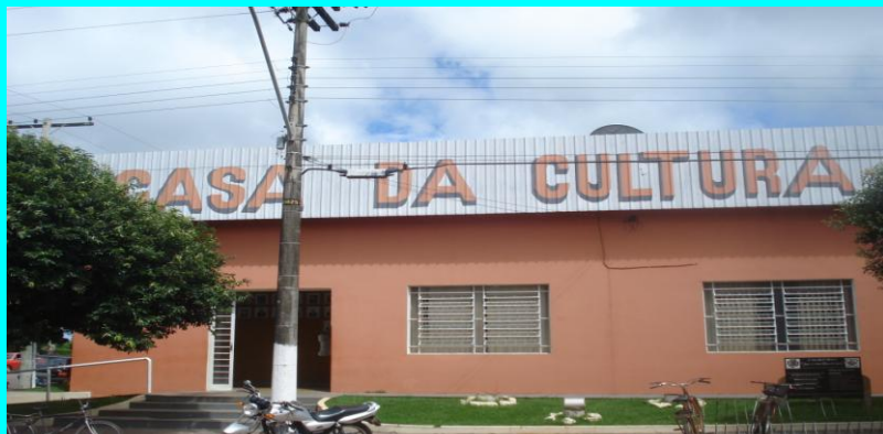
CULTURA A Casa da Cultura de Coroados (SP) foi o palco da 2ª PREVSEG realizada pela Gramatura, através do seu SESMT.

O evento foi um sucesso e teve envolvimento de todos os presentes.