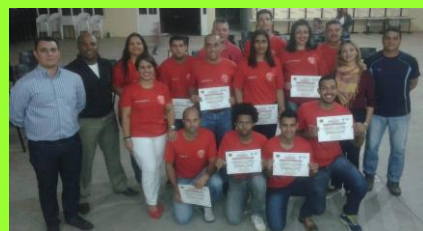
Novos bombeiros civis capacitados pela "Fire Fighter" em Araçatuba

Uma nova turma terá início neste sábado, dia 25 de junho e ainda tem vagas. Inscrições serão feitas na Rua Antonio Gomes do Amaral Nº 32.