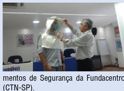
Equipamentos de Segurança da Fundacentro (CTN-SP).