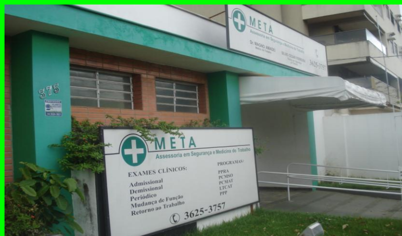
A META fica na Rua Major Mendonça, 375, Araçatuba (SP) (18) 2103-3757