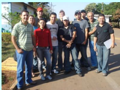
Alunos do TST 2008-B no início do curso em visita técnica.

No final do mês de abril, mais uma turma de TST será formada no SENAC Araçatuba (SP), com apresentação de projeto profissional previsto para as noites de 28, 29 e 30 abertos ao público.